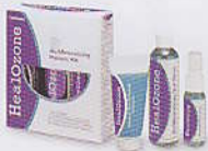
KaVo HealOzone® Patientenkit. Die Nachbehandlung für zu Hause.

KaVo HealOzone – keine Angst beim Zahnarzt. Für Kinder und Erwachsene.